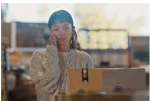
全国東宝系にて公開中 © 2024 映画『ラストマイル』製作委員会