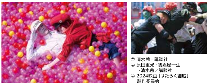
© 清水茜／講談社 © 原田重光・初嘉屋一生 ・清水茜／講談社 © 2024映画「はたらく細胞」製作委員会

■出演：永野芽郁、佐藤健／芦田愛菜／阿部サダヲ ほか ■監督：武内英樹 ■脚本：徳永友一 ■音楽：Face 2 FAKE ■主題歌：Official髭男dism「50%」(IRORI Records / PONY CANYON Inc.) ■配給：ワーナー・ブラザーズ映画 ■公開時期：大ヒット上映中